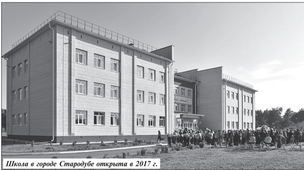
Школа в городе Стародубе открыта в 2017 г.

Тут региональная власть показала, что умеет грамотно общаться с честными строителями – были определены фирмы,