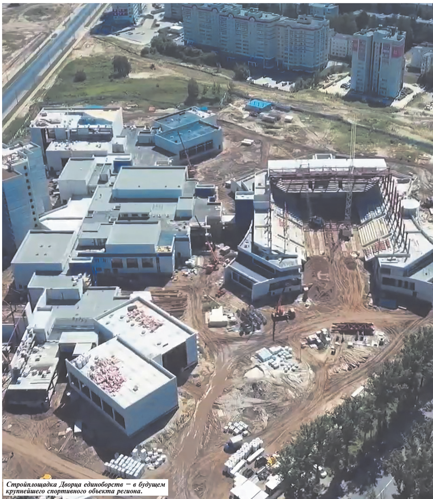
Стройплощадка Дворца единоборств — в будущем крупнейшего спортивного объекта региона.