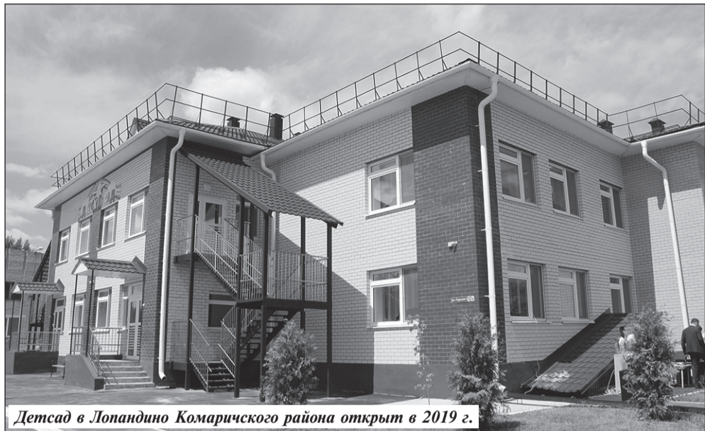
Детсад в Лопандино Комаричского района открыт в 2019 г.

готовые довести до сдачи проблемные дома. Самое главное в этой истории, что количество обманутых дольщиков сокращается, люди въезжают в новые квартиры.