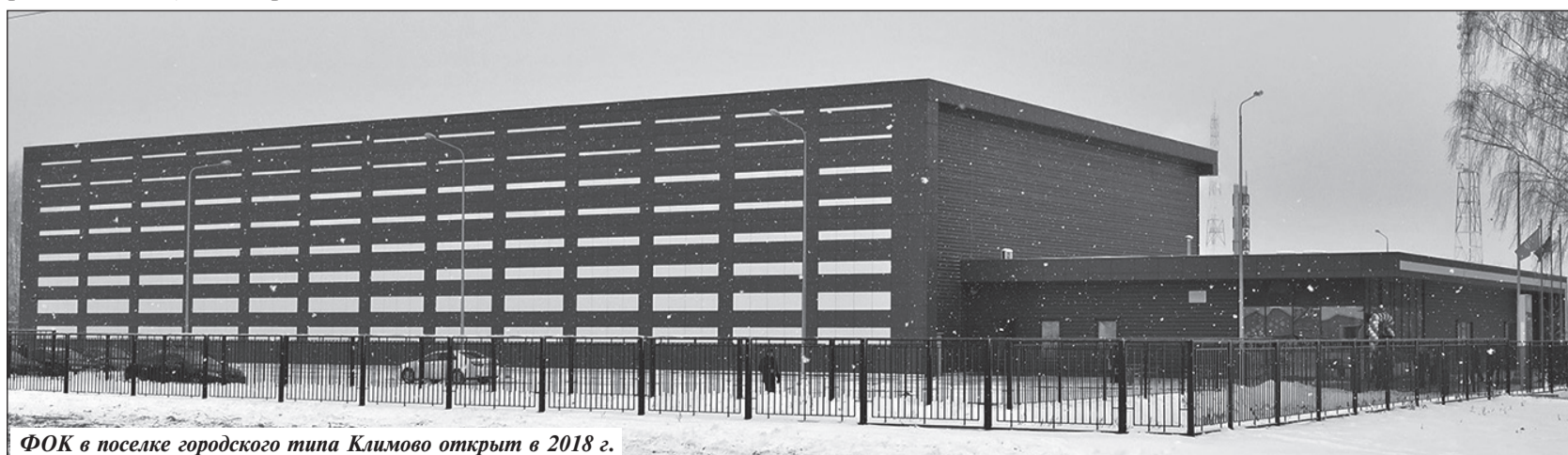
ФОК в поселке городского типа Климово открыт в 2018 г.

Понятно, что в идеале каждый из нас хотел, чтобы в шаговой доступности были и бассейн, и ледовый дворец, и физкультурно-оздоровительный центр. Но как часто мы готовы в них ходить? А ведь содер-